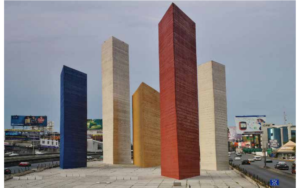
Obra: Torres de Satélite , esculturas monumentales Arq. Luis Barragán, Mathías Goeritz y Jesús "Chucho" Reyes Ferreira. Estilo: Arquitectura, segunda mitad del siglo XX Dimensiones de 30 a 52 metros de altura Ubicación: En Ciudad Satélite, Estado de México Inauguración en marzo de 1958.

Así, el arte también plasma los diversos rasgos de la cultura, especialmente en la actualidad, donde están presentes toda clase de expresiones artísticas, a causa de los grupos sociales heterogéneos existentes. De esta manera, más allá de un uso utilitario, representa el desarrollo de la creatividad, de la sensibilidad, del ingenio, promoviendo la creación, para cumplir con objetivos estéticos inspirados en muchas manifestaciones, así influye en el individuo, en la cultura y en la sociedad.