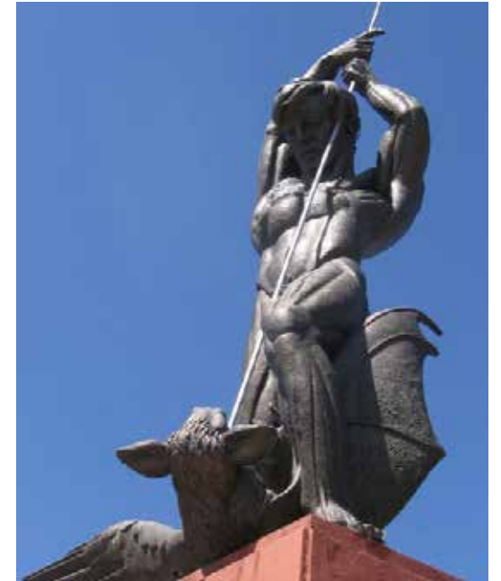
Obra: Monumento a la Razón (1962) "El Mono Bichi", Nogales, Son. Escultor: Alfredo Just Jiménez Tamaño: 14 metros de altura