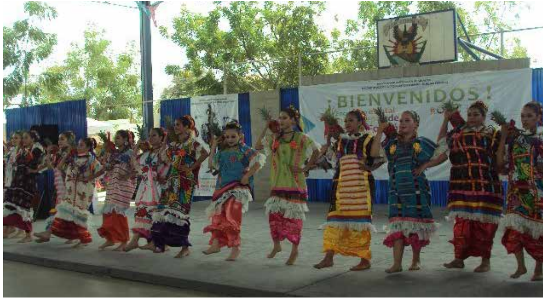
Demostración de danza