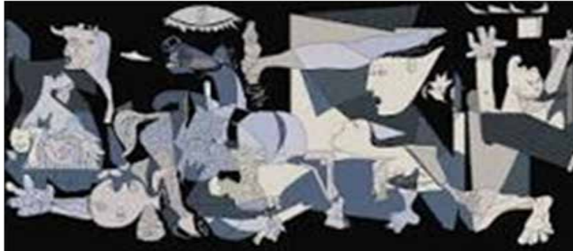
Obra: Guernica 1937 Autor: Pablo Picasso Técnica: Pintura al aceite Estilo: Cubismo Dimensiones: 349,3 x 776,6 cm Tema: Guerra Civil Española, Guerra, Sufri- miento Ubicación: Museo Nacional Centro de Arte Reina Sofía, Madrid, España http://www.museoreinasofia.es/coleccion/obra/guernica

El arte cumple con algunas funciones; probablemente reconocerás algunas como algo que tiene que ver con tu vida y quizás algunas te parezcan más lejanas. Aquí van: