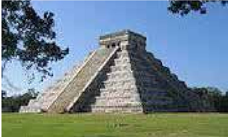
Pirámide de Chichen Itzá, Yucatán, México, 800-110 DC