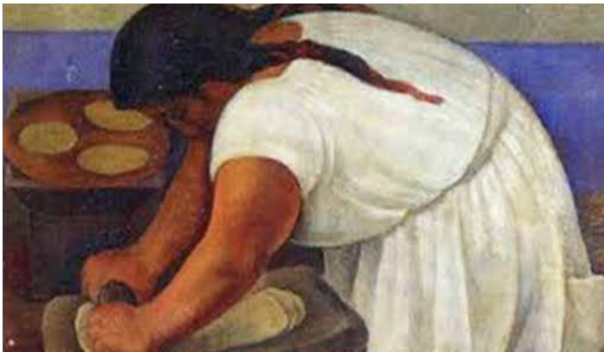
Obra: La molendera , 1924 Autor: Diego Rivera Técnica: Óleo sobre tela Estilo: realismo mexicano Dimensión: 105,4 x 132,5 cm Ubicación Museo Nacional de Arte, INBA)

En los últimos años, la sociedad ha sufrido un retroceso, no solo en el aspecto económico, eso es evidente. La crisis cultural se presenta como la otra cara de la moneda; aquella que, aunque cobijada por la sombra de una serie de problemas aparentemente más importantes, conforma un punto de vital importancia social que comienza a verse inmerso en terreno pantanoso. En el instante en que eclosiona la cultura y se resquebrajan las bases de una civilización curtidas con el paso de los años, lo que debiera haberse desgastado poco a poco, dándonos tiempo a reaccionar, lo ha hecho en un plazo pasmosamente corto.