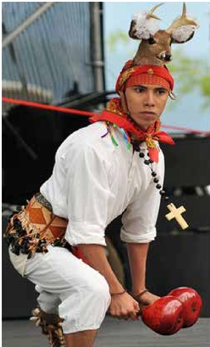
Danza del venado, Sonora (Yaquis)

Función cultural: El arte es un medio ideal para comunicar, educar, formar valores donde el espectador puede adquirir conocimientos sobre su identidad, sobre su pertenencia, y sobre su arraigo cultural. Dado que la producción artística es atractiva se convierte fácilmente en medio para darle forma a una cultura.