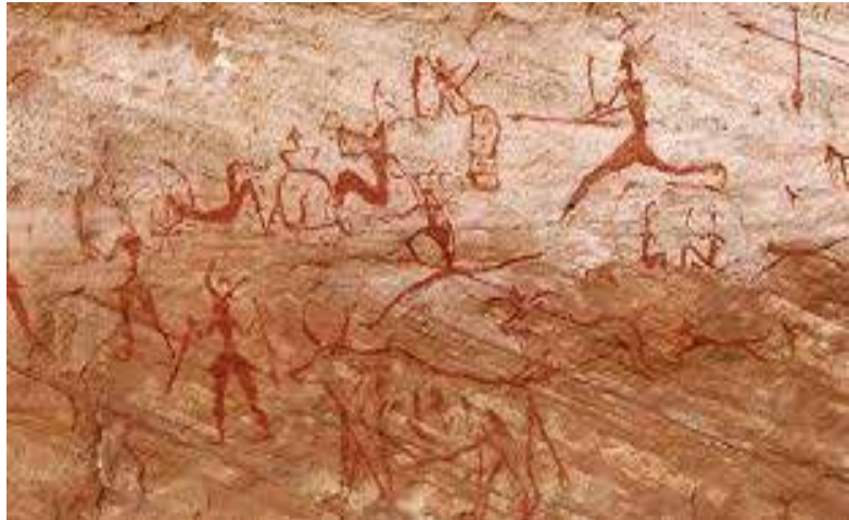
Pintura rupestre Baja California.