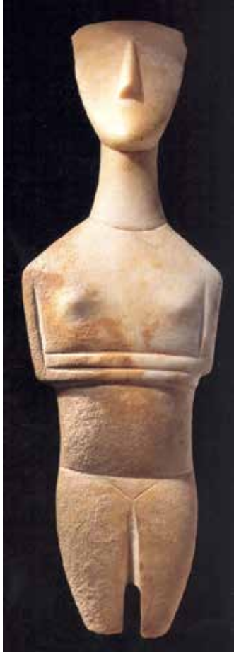
Estatuilla de mujer de pie desnuda. Siros. 3000-2100 a. C

Observa las siguientes imágenes. Menciona qué tipo de función del arte representan. Argumenta. En un segundo momento, consensan las respuestas en plenaria, con apoyo de tu docente.