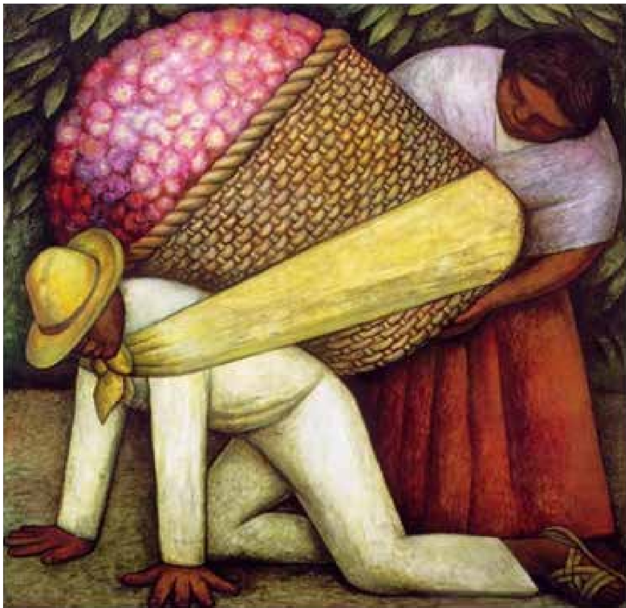
Obra: El Cargador de Flores (1935) Autor: Diego Rivera Estilo: realismo mexicano Técnica: pintura al aceite Ubicación Museo Nacional de Arte, INBA