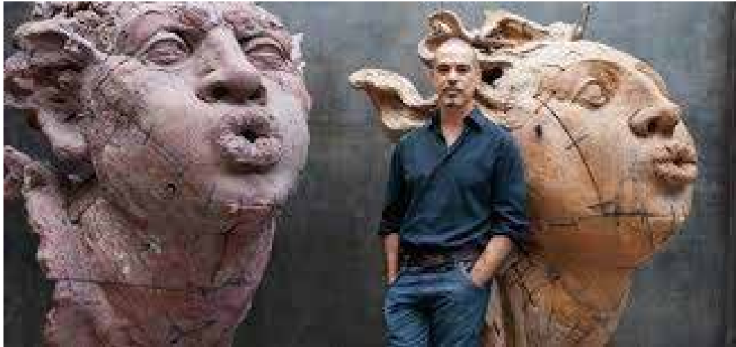
Escultura de Javier Marín, México, 1962.