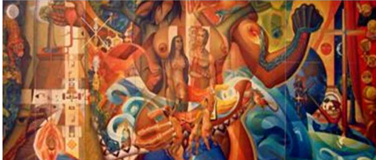
Mural de la plaza del Centro Cívico Constitución (1958) Rolando Arjona Amabilis