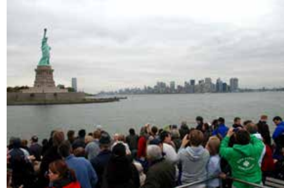
Gente viendo La Estatua de la Libertad