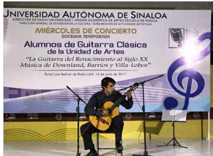
Demostración de guitarra clásica

Las formas de representación que toma el arte no son producto de la casualidad ni de las ocurrencias de quienes lo crean. Es una cuestión más formal: se relacionan con una concepción del mundo. ¿Cuál? La que existe cuando se produce el arte.