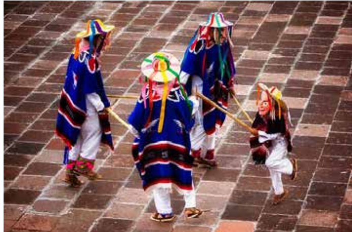
Danza de los Viejitos, Jarácuaro, Michoacán.