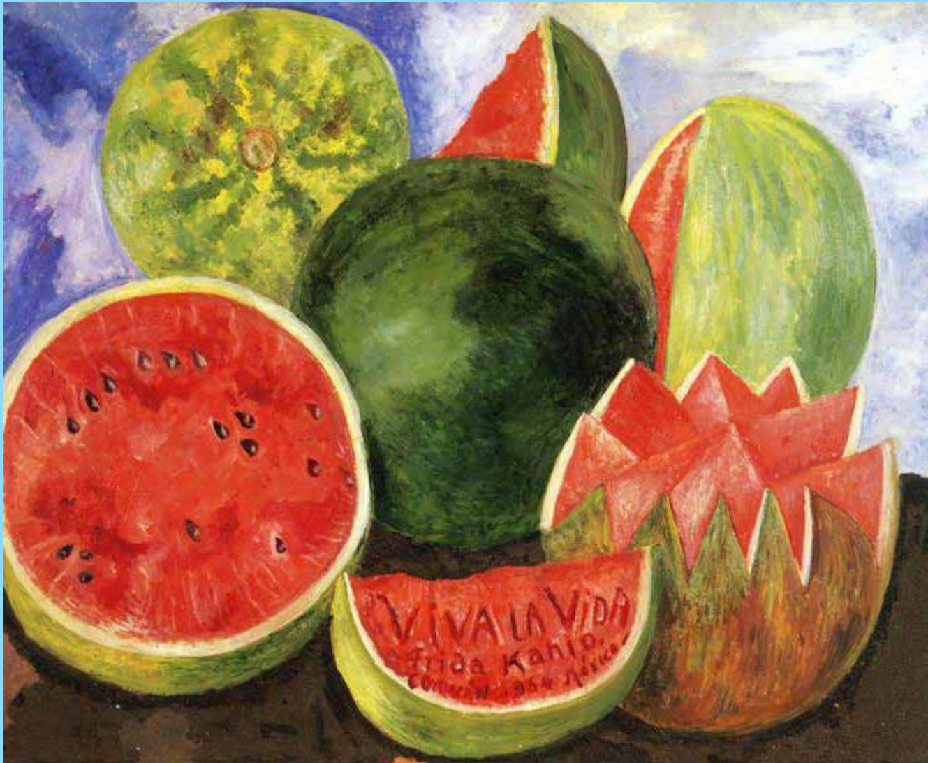
Obra: Viva la vida, sandías Autor: Frida Kahlo, México (1954) Técnica: Óleo sobre fibra dura Estilo: Arte moderno Tamaño: 59 x 50 cm Ubicación: Museo Frida Kahlo, Coyoacán, México.

El arte es necesario en el desarrollo pleno de todos los aspectos inherentes a la idiosincrasia de cada individuo y grupo social. Acercarte al umbral del mundo artístico, es reflexionar sobre qué significa arte, cómo se le llama al conjunto artístico y cuál es la importancia y función de la parte artística en ti.